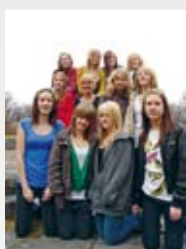
Omslagsbild: Ch.i.li. – mer än en kryddstark kör Läs mer på sidan 5