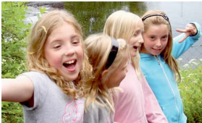
Under veckan med Sommarskoj blir det många trevliga stunder. Bilden är från Sommarskoj 2008.

Den här sommaren blir det förändringar av sommarskoj. De stora förändringarna är att det blir koncentrerat till en vecka, att man måste anmäla sig och att sommarskoj avslutas med att barnen får medverka på familjegudstjänsten den 28 juni.