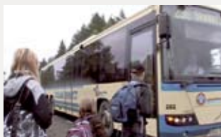
Församlingsresan görs med buss, men det blir inte med skolbussen som sjutsar skolbarn till Bureå.

Resan går till Åmsele och Vindelns via Kalvträsk och Mårdseleforsarna. Vi besöker kyrkan i Kalvträsk, kokar kaffe vid Mårdseleforsen. Resan går vidare till Åmsele där vi bl a tittar på och hör om "Försoningsplats". Vi äter middag i Vindelns och sedan går bussresan hem mot Bureå.