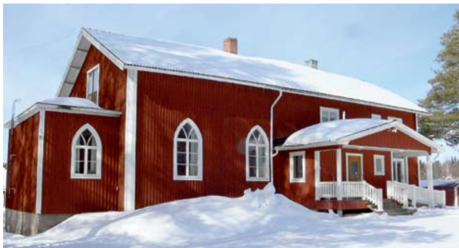
Sjöbottens bönhus i vinterskrud 2009, drygt 113 år efter invigningen i december 1896.

Anmälan gör du senast den 11 juni till pastorsexpeditionen, tfn 78 03 60.