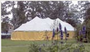
Det gulvita tältet har blivit ett stående inslag i Hembygdsparken i början på augusti.