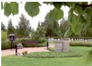
Gravasklunden är en av de platser som finns med på kyrkogårdsvandringen.