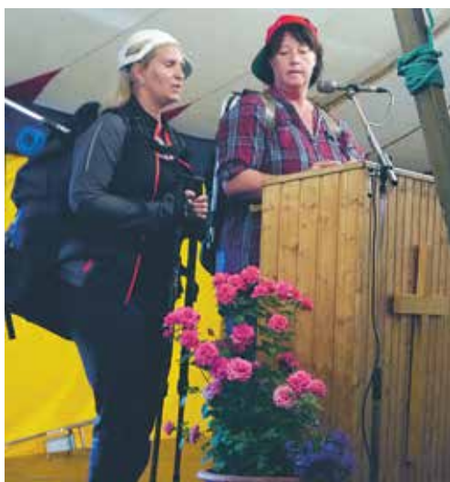
Fram till den 7 september har du möjlighet att skicka in dina bilder.

I senaste numret kunde du läsa om vår fototävling med temat "Sommar i Bureå församling". Fram till den 7 september har du möjlighet att skicka in dina bilder. Bilder du vill ha med i tävlingen skickar du som JPEG till: burea.forsamling@svenskakyrkan.se eller en pappersbild till Bureå församling, Skärvägen 2A, 932 52 Bureå. Tre priser delas ut; presentkort på 500, 300 och 200 kronor. Vinnarna presenteras i Nära nr 4.