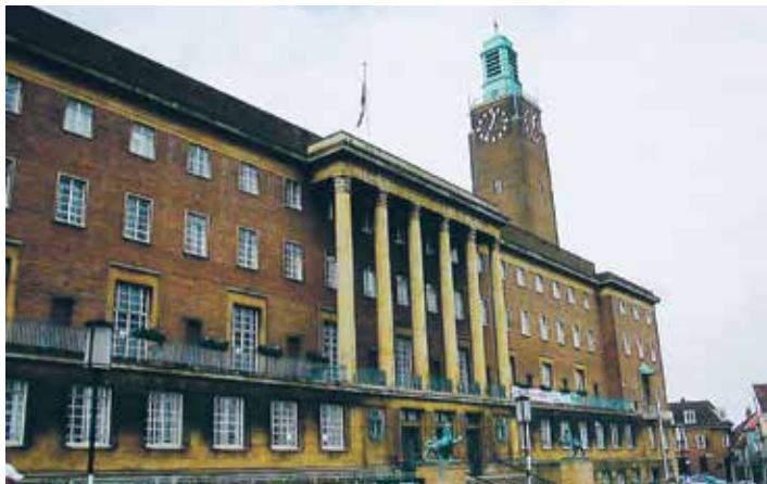
I centrala Norwich finns en byggnad som påminner om stadshuset Tre kronor i Stockholm.

Under sex dagar i mitten på september kommer personalen i Bureå församling att åka på en studieresa till England. Resan har under våren planerats i samråd med personal i Norwich stift (Church of England), som är vänstift med Luleå stift. Syftet med resan är att få såväl kunskap om hur man arbetar i några lokala församlingar, som inspiration från deras arbets-sätt och nytänk kring vad det är att vara kyrka i vår tid.