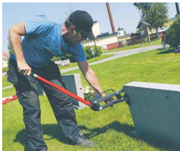
Dragtest av alla gravstenar kommer att utföras under hösten.

År 2011 omkom en 8-årig flicka när en gravsten på Bollebygds kyrkogård föll över henne. För att en liknande tragiska olyckan inte ska kunna hända här i Bureå har man på kyrkogården lagt omkull gravstenar som inte känns tillräckligt säkra och stabila. Den bestämmelse som gäller idag är att en gravsten ska klara ett tryck på minst 35 kilo både framåt och bakåt innan den välter.