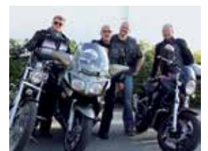
Omslag: Fyra av deltagarna i den kristna motorcykelklubben i Bureå.