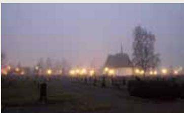
Kyrkogården i novemberdis.

Fredag 3 november är gravkapellet öppet kl 12-18 för samtal, eftertanke och kaffeservering. Alla Helgons dag, lördag 4 november är det öppet kl 12-15. Orgelmusik i gravkapellet kl 13