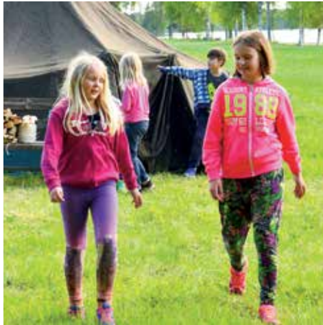
Vårterminen för scoutgruppen i Örviken avslutades med en hajk i Östra Falmark.

Utförlig information finns på hemsidan och annons i Norran vecka 35, 29/8-3/9.