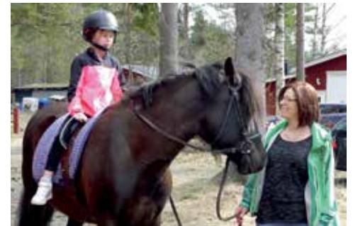
I början på maj har SALT-gruppen i Sjöbotten Barnes dag med olika aktiviteter, bl a ridning.

Under hösterminen kommer EFS grupper i Bureå, Sjöbotten och Östra Falmark att ha en del träffar tillsammans. Mer information om det kommer inom kort.