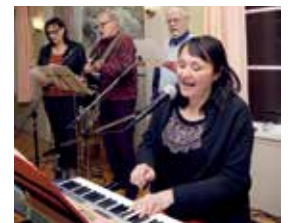
Omslag: Burviksgruppen sjöng under veckomässan i Burvik.