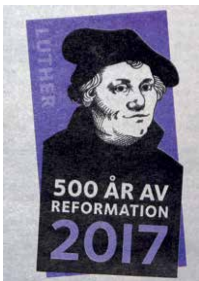
500 år av reformation kommer att uppmärksammas på olika sätt under nästa år.

glädje. Man skulle kunna kalla Luther för den store pessimisten när han hävdar att vår förmåga att styra och kontrollera våra kroppar och beteenden via Anden inte alltid fungerar så väl som vi vill. Luthers realism ledde honom till att kritisera de som hävdade att man kunde skapa syndfria zoner vare sig i kloster, kyrkan eller samhälle. Enligt Luther var detta att lura sig själv. För Luther blev det allt tydligare, att vara människa innebar att leva med ont och gott sida vid sida. Luther myntade ett uttryck på latin för detta: simul justus et peccator.