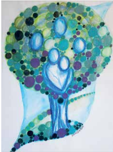
Karins akvarell som heter "Starka rötter och vingar".

Så vad väntar du på? Fria till din älskade och ring sedan pastorsexpeditionen för att boka er vigsel. Det viktigaste är inte var vigseln sker eller vilka kläder ni har på er. Det viktigaste är att ni gifter er. Innan vigseln