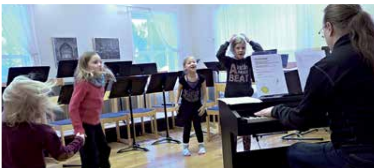
Det är full fart när barnkören har sina övningar.

Det är vi som arbetar för dig. Hör gärna av dig!