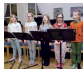
Omslag: Fem av barnen i den äldre gruppen i barnkören.