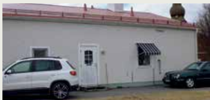
Kyrkogårdsförvaltningen finns på Munkvägen 8B.

För bokning av begravningar och frågor om gravskötsel och kyrkogårdsärenden, kontakta kyrkogårdsförvaltningen, 70 80 70. Besöksadress: Munkvägen 8 B.