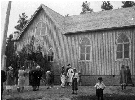
Det var 1937 som bönhuset i Sjön invigdes.