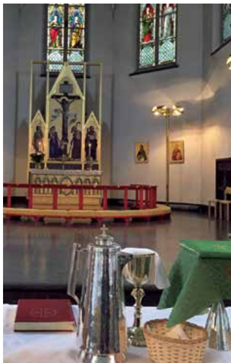
En morgonmessa firades i Luleå Domkyrka

Kulturhuset var samlingspunkten för gudstjänster, föreläsningar, teater, utställningar och tid för samtal. Utifrån helgens tema "Fri till tro" ställdes frågan: hur kan Luther idag inspirera oss till att våga vara kyrka, skriva nya teser, tänka i nya banor och tänka helhet?